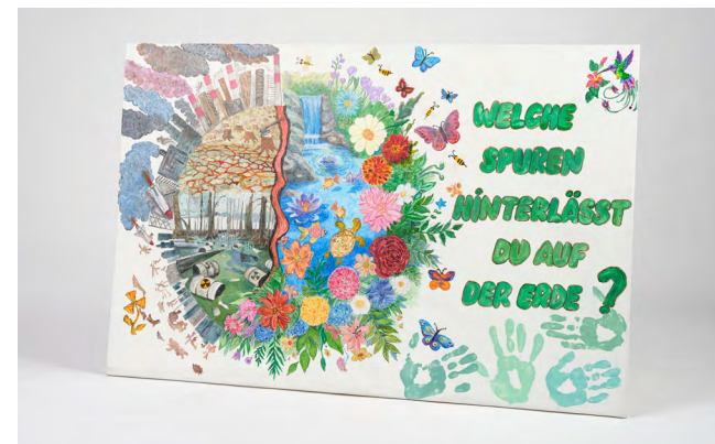
WELTBILD, ZU DRITT GESTALTET.